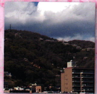
岡本から望む保久良神社付近の桜回廊