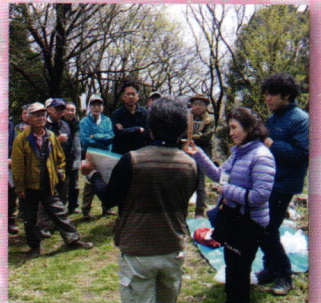
判り易くて楽しい樹木教室