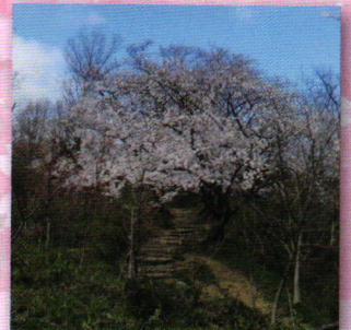
金鳥山に向う登山道沿いのサクラ