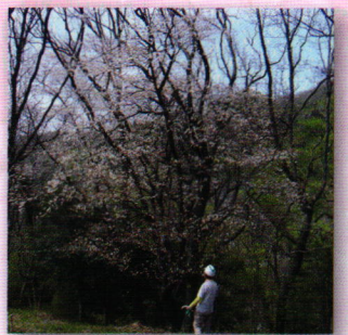
見事に満開のヤマザクラ