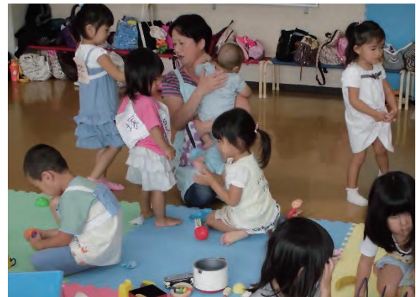
児童館での活動の様子(イメージ)