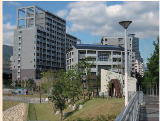
災害復興住宅HAT脇の浜

HAT脇の浜は街の西側に位置し、東西に走る道路の北側の災害復興住宅と南側の分譲住宅などからなる。また、中央には高齢者福祉施設が配置されている。