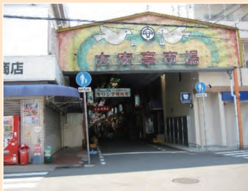
吾妻地区大安亭市場

中央区では平成23年度から地域福祉ネットワーク事業を開始したが、その初年度に吾妻地区をモデル地区に指定。地域で気軽に相談できる場として『何でもいうてや』と名付けた相談窓口のほか、そこに寄せられた様々な課題を解決するために定期的に地域福祉ネットワーク会議を開催している。