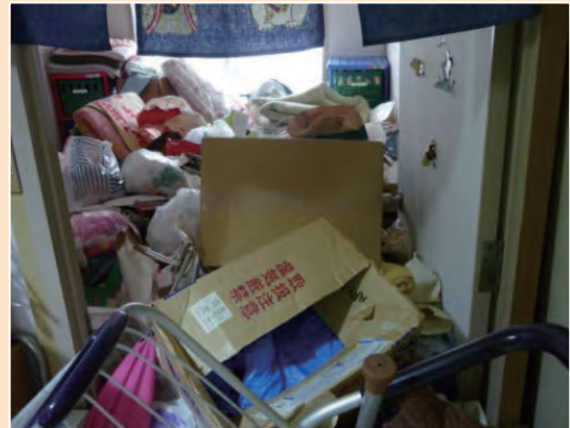
女性の自宅(片付け前)