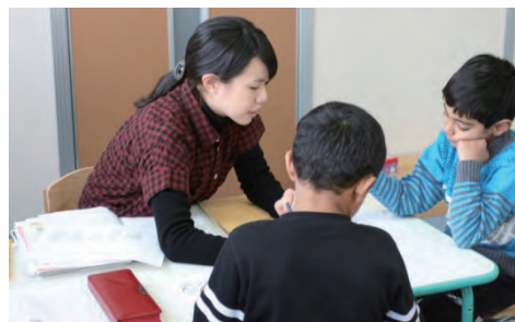
「はいず」での学習の様子

『はいず』には同じルーツを持つ友達がいる、同じ言葉で話せる大人がいるということで、子ども達は週1回『はいず』に通うのを楽しみにしている。