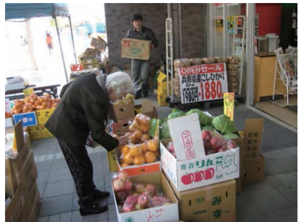
新たに誘致したコンビニの様子

「高齢者の閉じこもり」という福祉課題だけにとらわれず、福祉の視点を持って「まちづくり」を考えたことで、高齢者に配慮された新しい店舗の誘致という最良の結果につながった。